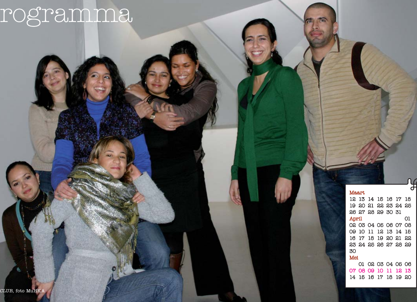
MOUSSEM CLUB