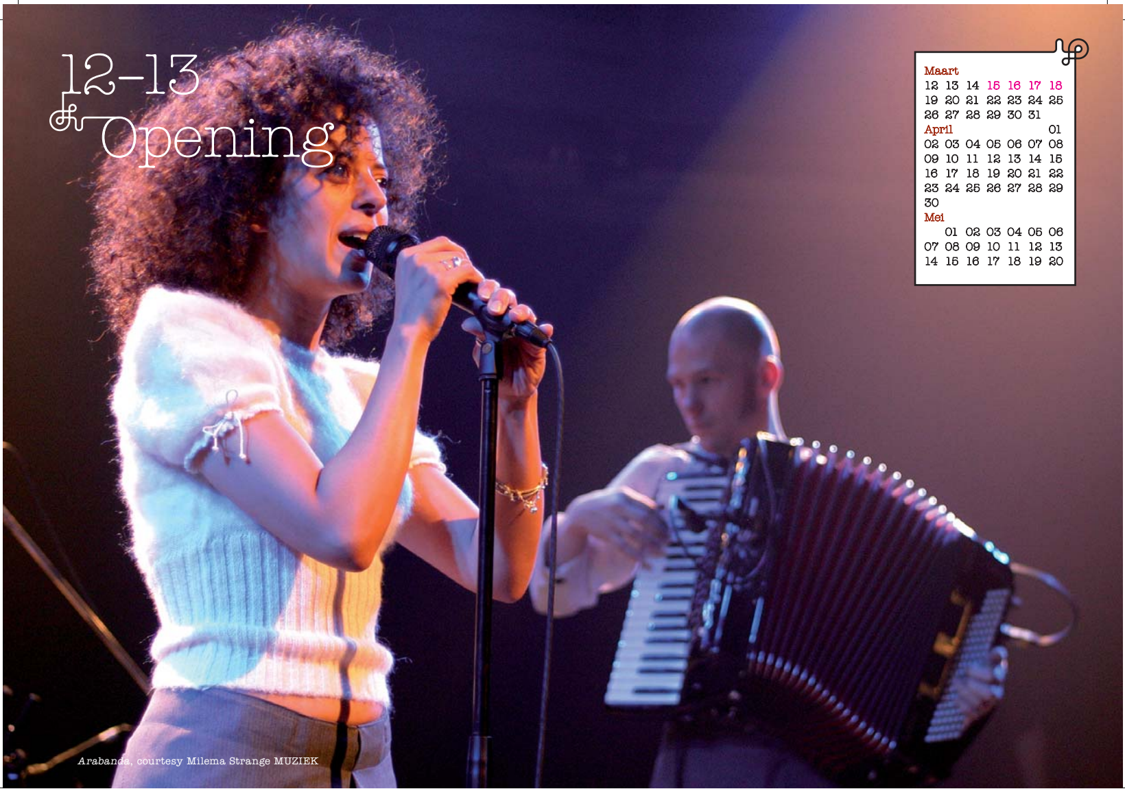
Arabanda, courtesy Milema Strange MUZIEK