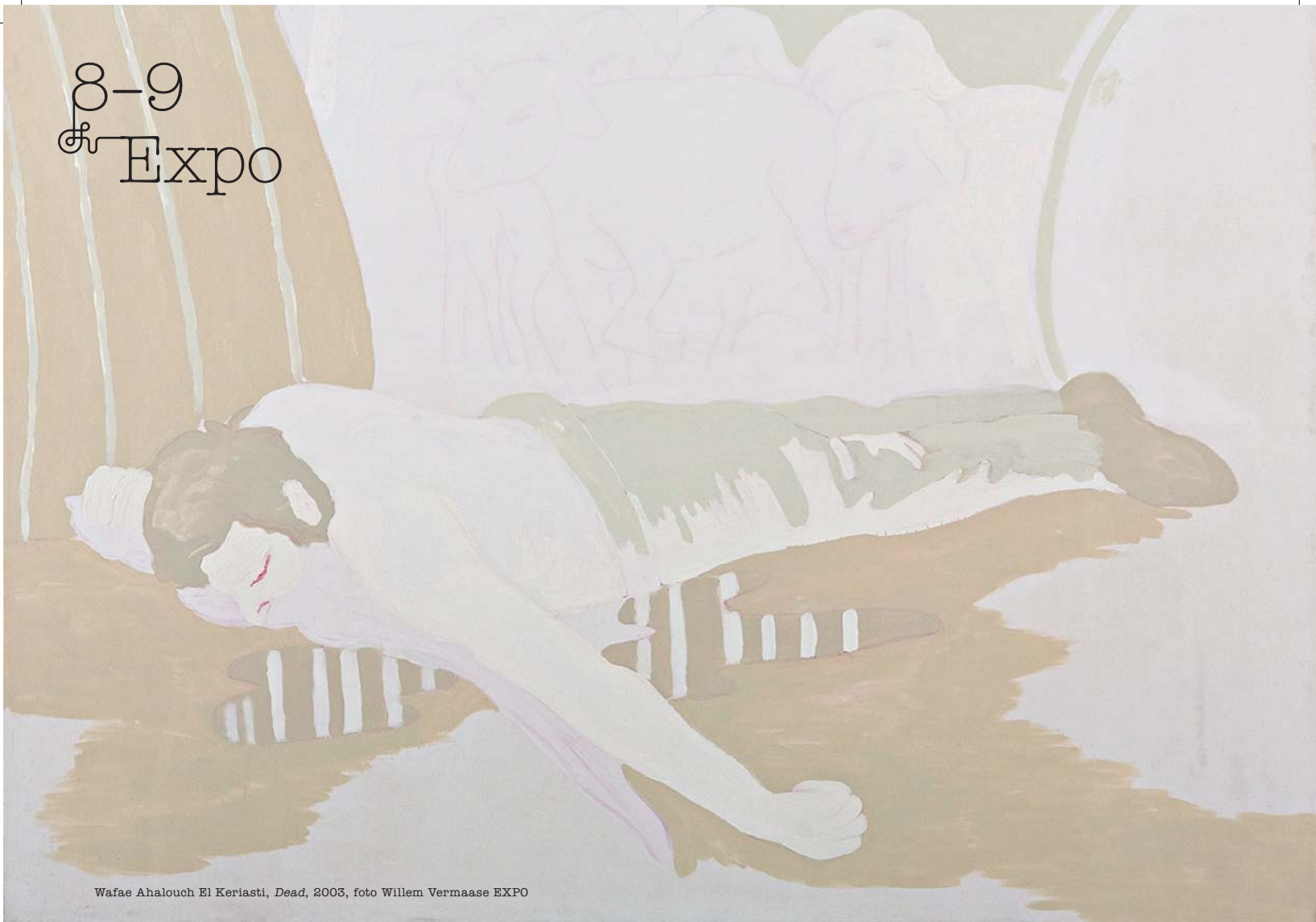
Wafae Ahalouch El Keriasti, Dead , 2003, foto Willem Vermaase EXPO