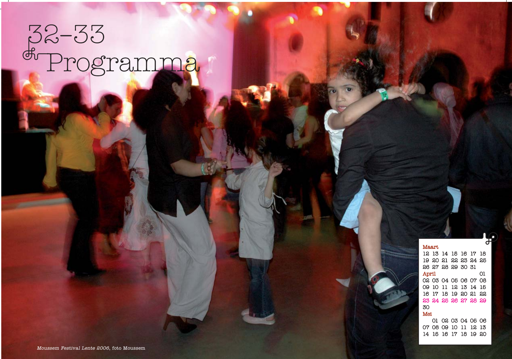
Moussem Festival Lente 2006