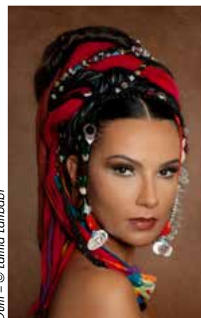
Oum