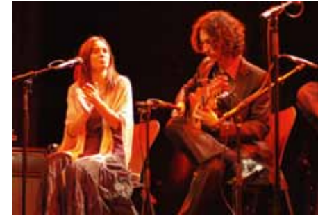
Imetlaâ & NL El Mundo