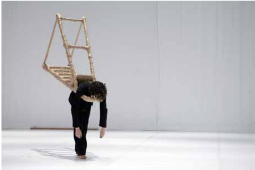
Cie 2k far